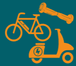
VEICOLI A BATTERIA