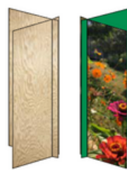
Reticolo ecologico o rete ecologica