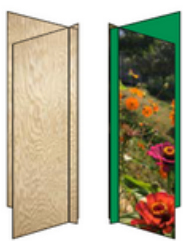
Spazi verdi in ambito urbano